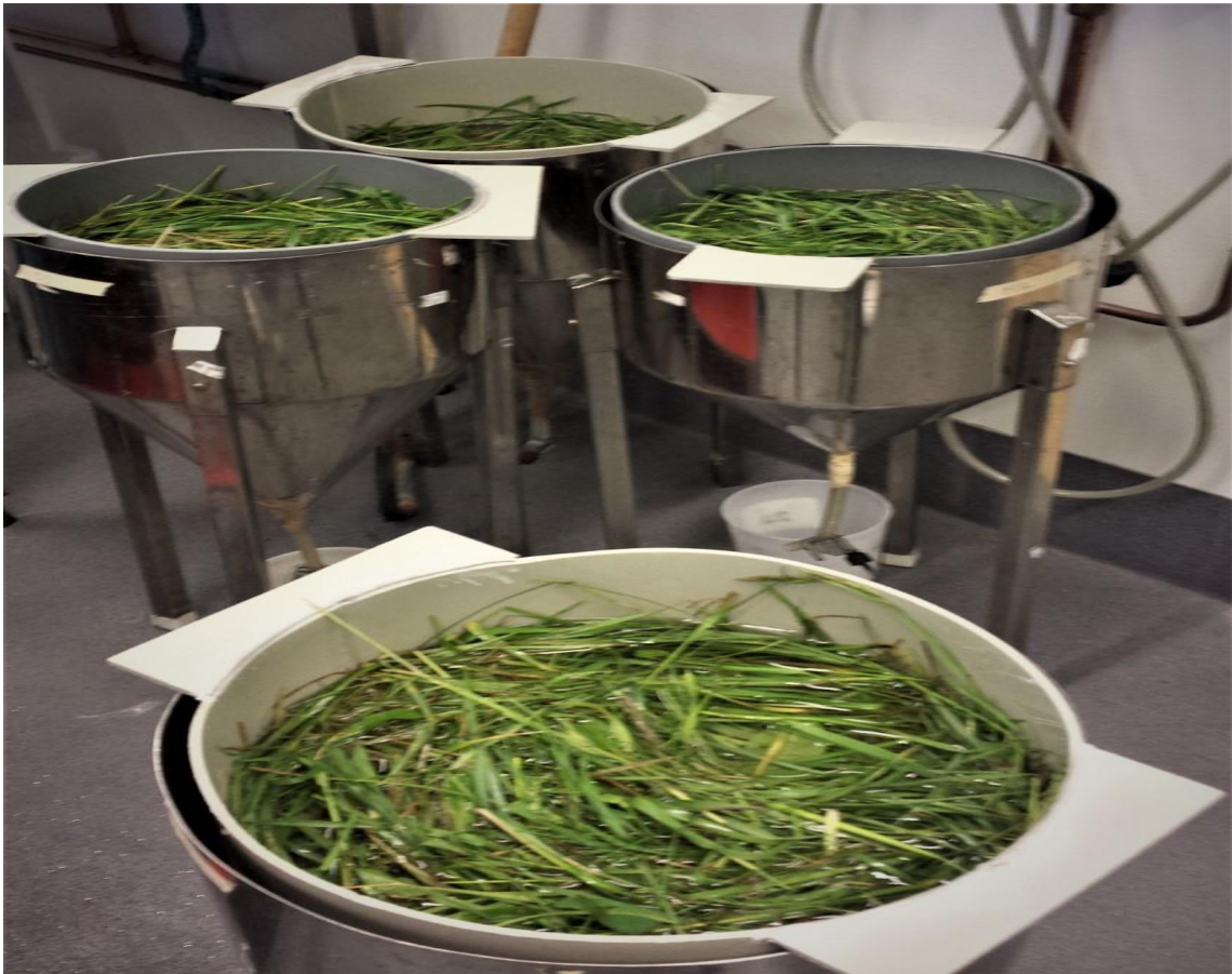
Figur 4. Gräsproverna preparerade i Baermann-trattar.

De insamlade gräsproverna vägdes och placerades i stor Baermann trätt av metall försedd med finmaskig sil, gummislang och slangklämma, se figur 4. Ljummet kranvatten tillsattes så att gräset täcktes av vattnet. Provpåsen sköljdes ur med ljummet kranvatten, så att allt insamlat material hamnade i silen. Gräset blandades och lämnades sedan att stå under ett dygn. Dagen efter tappades 45 milliliter vätska av i ett centrifugrör (Falconrör) genom att klämman runt gummislangen försiktigt öppnades. Rören med vätska centrifugerades i två minuter med 1000 revolutions per minute (rpm). Det översta skiktet sögs upp med en vätskesug. Fem milliliter vätska per prov mikroskopoperades. Till hjälp vid mikroskoperingen användes Lugols jodlösning, en femprocentig jodlösning, för att avdöda och färga larver. Antalet L3-larver av blodmask i proven räknades. Gräset torkades i ett nät under två veckor och vägdes därefter. Slutligen kalkylerades antalet blodmasklarver per kilo betesgräs i torrsubstans för den mockade respektive omockade hagen.