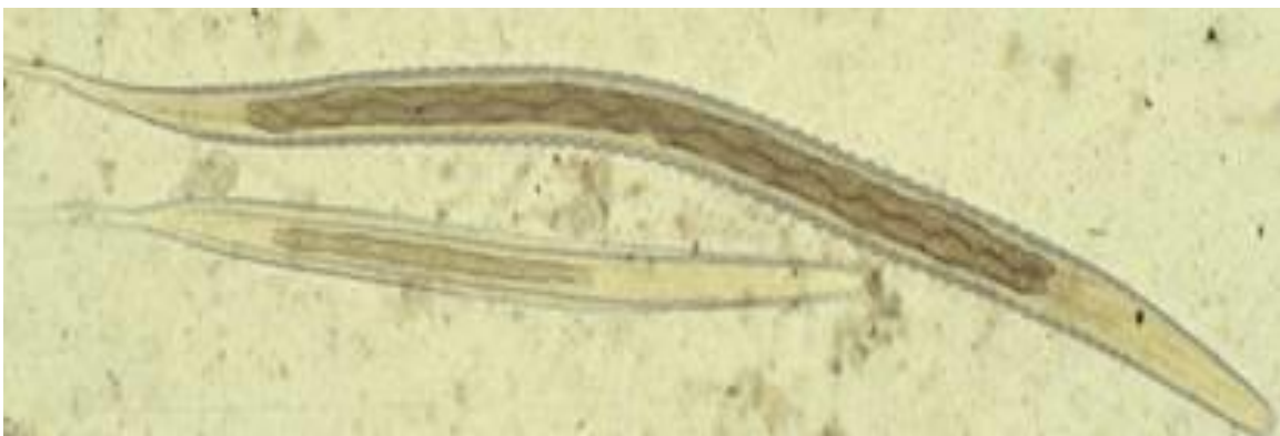
Figur 2. Överst på bilden visas Strongylus vulgaris och den undre är en Cyathostominae, bägge i det tredje larvala stadiet.

Prepatenstiden för S. vulgaris är omkring sex månader (Osterman Lind 2005)